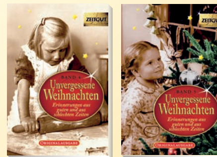
Band 4, 1923–1994 ISBN 978-3-86614-135-3 Band 5, 1918–1992 ISBN 978-3-86614-146-9