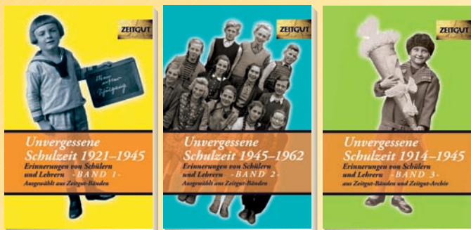
Band 1 Band 2 Band 3

Unvergessene Schulzeit , Erinnerungen von Schülern und Lehrern jeder Band 192 S. mit vielen Abbildungen, Ortsregister, Schul-ABC. Band 1, 1921–1945 , ISBN 978-3-933336-100-6, Euro 6,90 Band 2, 1945–1962 , ISBN 978-3-86614-101-8, Euro 6,90 Band 3, 1914–1945 , ISBN 978-3-86614-120-9, Euro 6,90