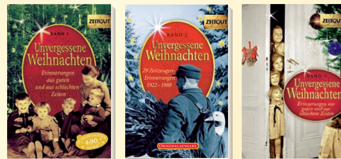
Band 1, 1918–1959 ISBN 978-3-933336-73-6 Band 2, 1922–1988 ISBN 978-3-86614-103-2 Band 3, 1914–1994 ISBN 978-3-86614-122-3